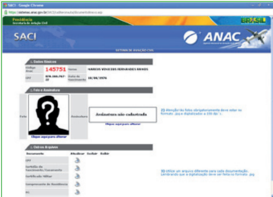
Tela do Sistema de Aviação Civil após a geração de código ANAC